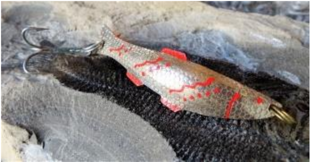
Osesluk Enkel, nr. 105-108. Den kom i flere størrelser med og uden skæl og bemaling. Let dorgeblink, også brugt som kasteblink til laks og ørred.