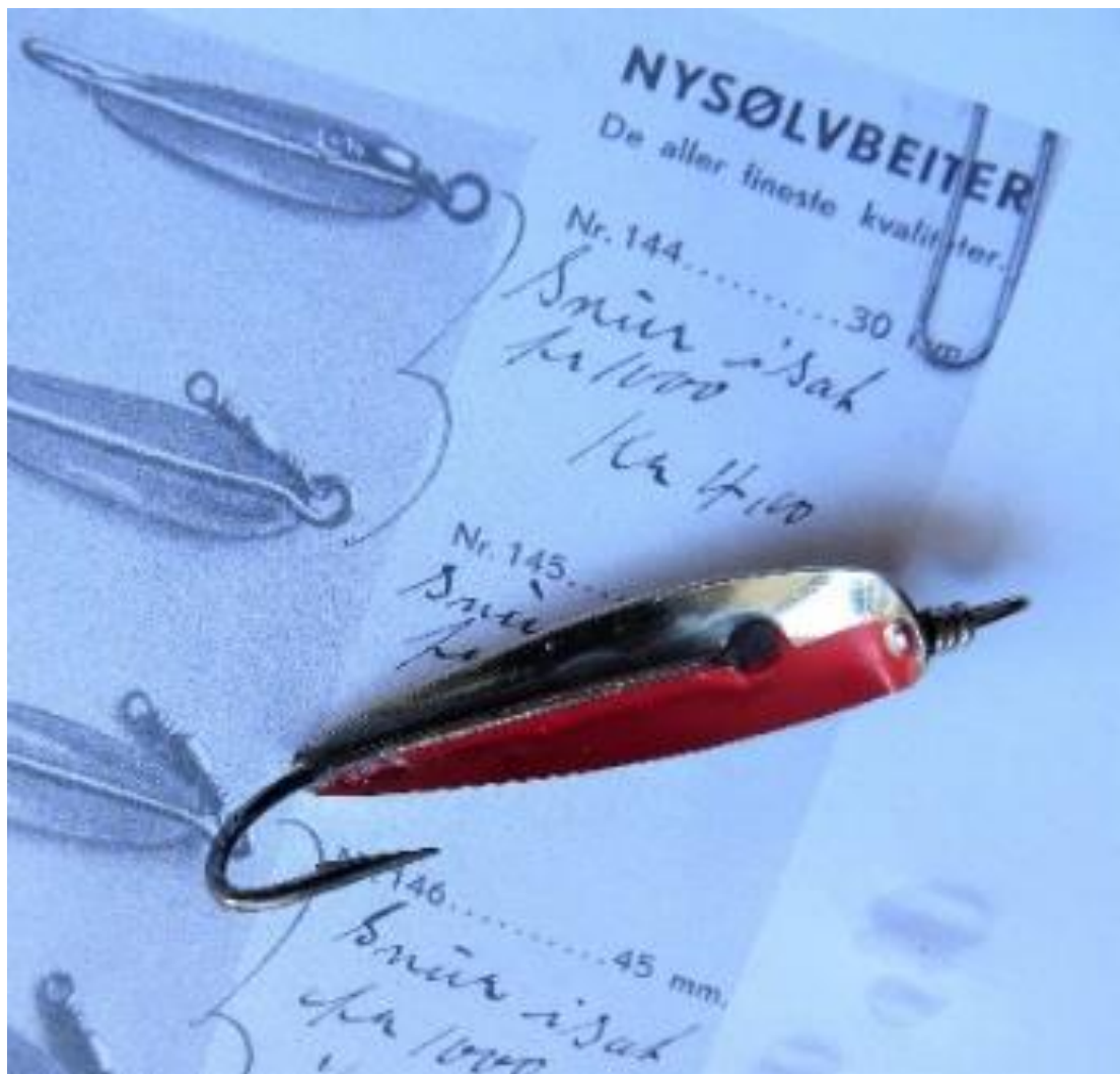
Nysølvbeiterne udgjorde en vigtig del af produktionen. De kom i størrelser fra 30 til 75 mm og blev rigget på fiskeharper til makrelfiskeri, men også til sej og lubbe.