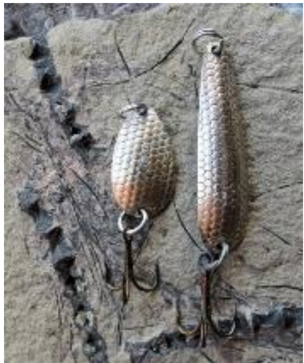
Det 'samme' blink kom ofte i flere størrelser, udformninger og anvendelsesmuligheder – et lakseblink til venstre og et ørredblink til højre. Samme koncept ved siden af: sluk nr. 190 og nr. 193 – et buttet og et slankt.