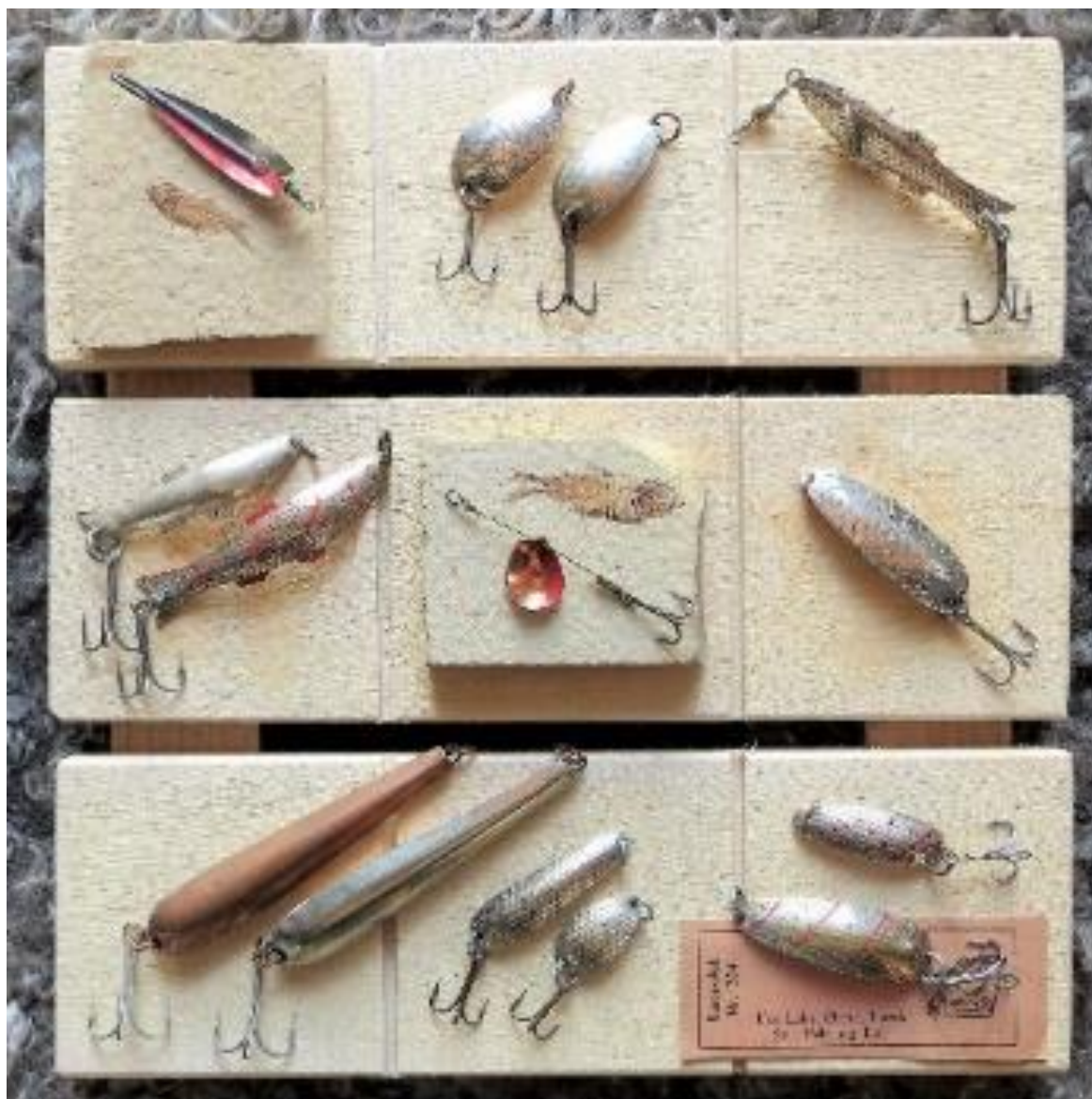
En del af min samling.