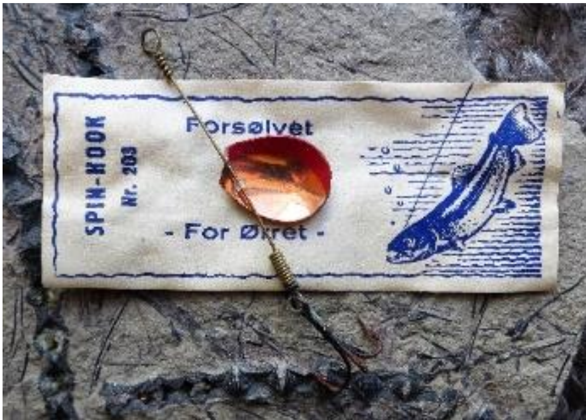
Spin-Hook nr. 203. En lillebitte spændende ørredspinner. Bladet er kobberfarvet med rød streg på indersiden og forsølvet på ydersiden. Krogene holder sig ofte godt på Oseslukene, alderen taget i betragtning, men denne her har set bedre dage. Nogle af Spin-Hook-spinnerne havde fjer på krogen.